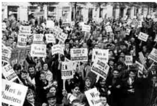
44 - De Eerste Mars op Brussel in 1961.

afdeling van de Katholieke Universiteit Leuven naar Wallonië geëist”, dit als reactie op zowel de inhoud als de teneur van het 'mandement' van de Belgische bisschoppen in verband met de Leuvense universiteit, waarin dezen de splitsing scherp hadden afgewezen.