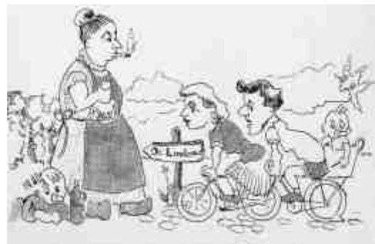
77 - Illustratie op de uitnodiging voor de fietsrally.