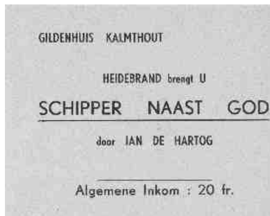
66 - Ticket toneel 'Schipper naast God'.