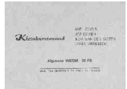
72 -Inkomkaart kleinkunstavond.