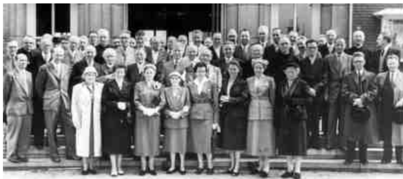
45 - Het Kempisch Congres in 1956.

carrière bleef Herman Suykerbuyk nochtans de CVP trouw. Wel was hij binnen de grootste politieke partij in België jarenlang dé Vlaamse stem, dikwijls roepende in de woestijn.