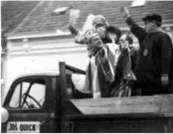
88 - Het eerste carnaval in Essen : met de vrachtwagen van Quick naar rusthuis Sint-Michaël.

Na de officiële ontvangst op zondag 21 februari op het gemeentehuis, vertrok om 15 uur een eerste optocht door de gemeente. Die bescheiden eerste stoet bestond uit een paar versierde vrachtwagens, een boerenkapel en een