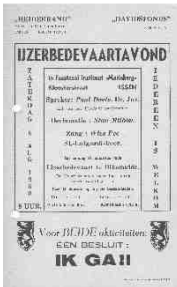
41 - Uitnodiging IJzerbedevaartavond 1960.

In 1986 erkende de Vlaamse Raad, nu het Vlaams Parlement, de IJzertoren als Memoriaal van de Vlaamse Ontvoogding, en in 1992 werd de toren beschermd als monument en de weide als dorpsgezicht. Ook de traditie van de bedevaarten werd, met ups en downs en ook binnen de Vlaamse Beweging niet altijd onomstreden, verdergezet.