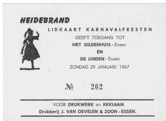
91 - Inkomkaart carnavalsbals 3e carnaval 1967.