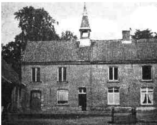
58 - Het binnenkoer van De Greef (oostzijde) in 1960.