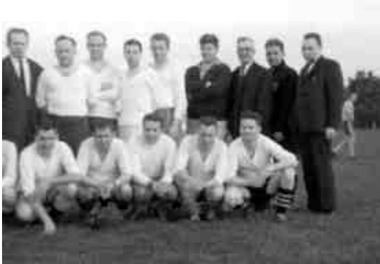
74 ab - Heidebrand op het voetbalveld.