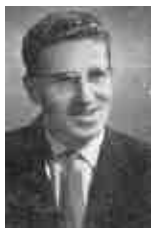
80 - Piet Theys.

Heidebrand gekroond werd was sportjournalist Piet Theys. Theys kreeg deze eretitel bij de viering van het derde lustrum, in oktober 1970. Geboren op 4 augustus 1927 te St.-Genesius-Rode begon hij in augustus 1959 zijn carrière op de BRT, en werd op korte tijd een befaamd radioman. Hij versloeg meermaals de Ronde van Frankrijk. In 1961 kreeg hij van de Belgische Sportpersbond de prijs voor de best geschreven sportreportage, en verwierf tevens de 'Oscar 1961' voor het beste radiowerk. Daarnaast schreef Piet Theys vele korte verhalen en humoristische poëzie. Zijn spreektalent viel te bewonderen in talloze radiokronieken, maar ook in het televisieprogramma "t Is maar een woord". In 1968 schreef hij het 'Grootboek van de Sport'. In 1974 overleed Theys op tamelijk jonge leeftijd.