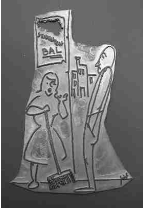
73 -Mal van een tekening van Piet Tirliren voor een uitnodiging voor een studentenbal.

naar het Noorden te komen is wellicht ook het gevolg van het relatienetwerk dat de club intussen had opgebouwd, zeker op politiek vlak met Suykerbuyk en Jacobs. Voor de meeste van die avonden werd iedereen uitgenodigd. Er was ook voor elk wat wils : van cultuur naar sociale beweging en van politiek naar wetenschap en economie, voor de Heidebranders waren dit kleine stappen. Het ging telkens om betrokkenheid met wat er in de wereld gebeurde en om bewustmaking; cultuur doorgaans met een kleine 'c', maar fel gesmaakt door de studenten en de genodigden. Eén van de grootste verdiensten van Heidebrand op cultuurvlak was misschien wel dat ze de traditie van de Groot-Kempische Cultuurdagen geprobeerd hebben in stand te houden.