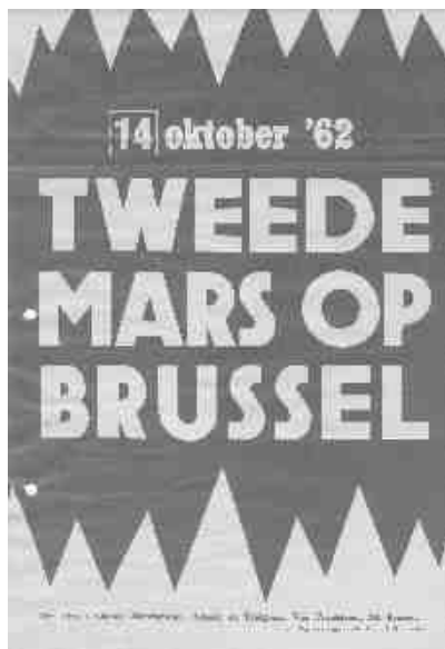
39 - Affiche van de Tweede Mars op Brussel in 1962.