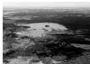
64 - Het Stappersven in het Grenspark Zoom-Kalmthoutse Heide.