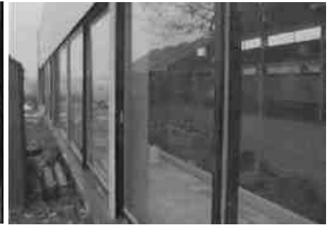
85 abc - De bouw van het Essense zwembad.