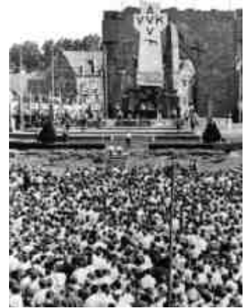
40 - De IJzerbedevaart in 1962.