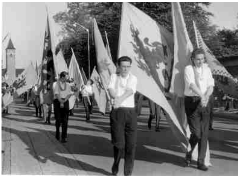
43 - Honderd Leeuwendvlaggen in de burgemeestersstoet.