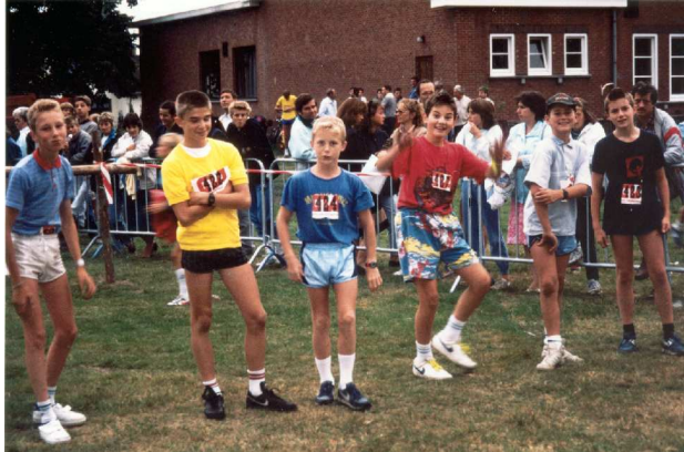
Aan de start in Statie in 1988.