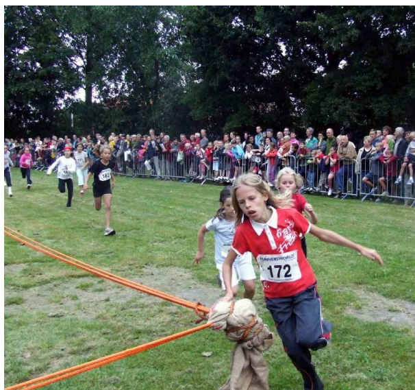
Zigzagloop Horendonk 2007.