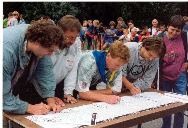
Ondertekening van het jeugdcharter op de zaterdag van de Ronde in de aanloop naar de gemeenteraadsverkiezingen van 1994.

Zo belanden we ook bij de gemeentepolitiek : heel wat geëngageerde jongeren die meewerkten aan de Ronde vonden vroeg of laat ook de weg naar een partijpolitiek engagement. En natuurlijk hebben ook gemeentepolitici kinderen die graag meelopen met de Ronde. Zeker in verkiezingsjaren werd de Ronde zo al eens campagnerrein, met name aan de toeg. Maar iedereen bleef het er altijd over eens dat de Ronde er voor héél Essen is, en als iemand het gevoel kreeg dat er toch wat te veel geprobeerd werd om aan politieke recuperatie te doen werd daar door de medewerkers ook wel eens op gewezen.