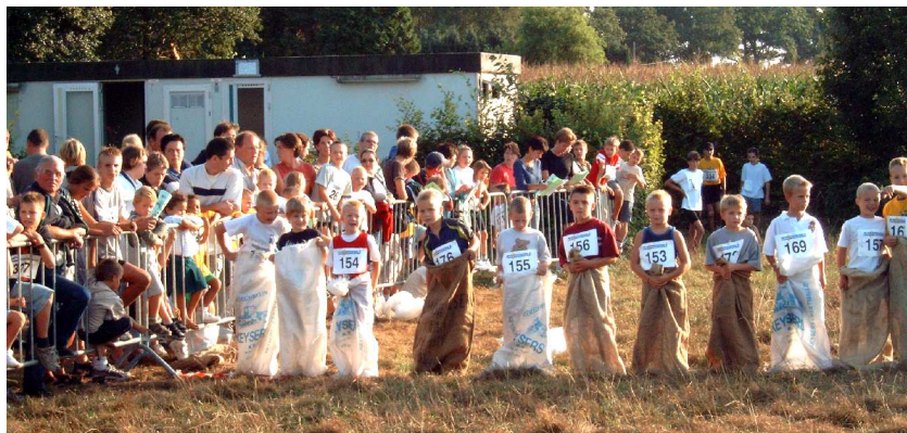
Zaklopen in Hoek in 2003.

Aan de promotie zal het nochtans nooit gelegen hebben. De Ronde verspreidde affiches en werd aangekondigd op de geschilderde gemeentelijke aankondigingsborden, of plaatste zelf borden in het Essense straatbeeld. Sinds een jaar of tien wordt ook stoepkrijt ingezet. Een brief met de tekening van de kleurwedstrijd, en later een volwaardige folder, werd in de klas uitgedeeld tijdens de laatste schoolweken of ging mee met de reclameblaadjes. De Ronde werd aangekondigd in de “gemeentelijke berichten”, de lokale pers en door de Essense jeugdbewegingen.