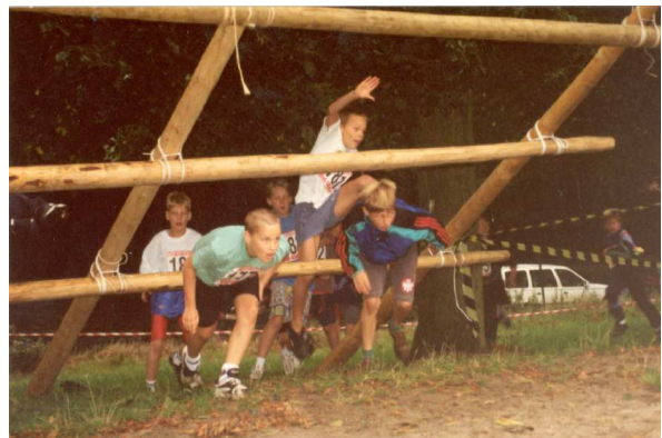
Hindernissen in Statie in 1996.

De deelnemers van die volkscross werden nooit meegeteld in de "officiële" deelnemersaantallen van de Ronde. Die gingen de eerste jaren in stijgende lijn. In 1973 telde de organisatie 60 lopers, maar al in 1976 ging het aantal boven de 300. Dat niveau kon niet worden vastgehouden. Begin jaren 1980 schommelde het aantal lopers rond de kaap van 200. Gestaan nam het aantal inschrijvingen af tot 130 in 1988. De concurrentie van de toenmalige sportweek van de gemeente zat daar beslist voor iets tussen, maar de fut bleek ook wat uit de Ronde.