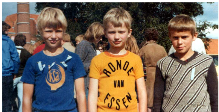
Dagpodium in 1978

Grote pluchen beesten waren immers gedurende jaren een vast onderdeel van de prijzentafel. Toch kreeg Verhulst die wellicht niet, want zeker in de beginjaren was het reglement op dat punt vrij streng : wie twee dagen niet meeliep, kreeg geen prijs. En Verhulst liep dus niet alle dagen mee. Nochtans was de Ronde altijd gul met die prijzen. Wie wel elke dag meeliep mocht een keuze maken aan de prijzentafel en kreeg een diploma. De leider in de tussenstand mocht al van in de beginjaren de gele trui dragen en de eindwinnaar kreeg deze ook mee naar huis. In 1991 en 1998 werd de gele trui een witte trui, en in 1983 een blauwe - maar een echte leiderstrui hoort natuurlijk geel te zijn en daar werd nadien niet meer van afgeweken. Daarnaast krijgt de winnaar een gouden medaille, en voor de nummers twee en drie zijn er zilver en brons. In de beginperiode werd men zelfs elke dag naar het ereschavotje geleid om er een geel, grijs of blauw lintje opgespeld te krijgen.