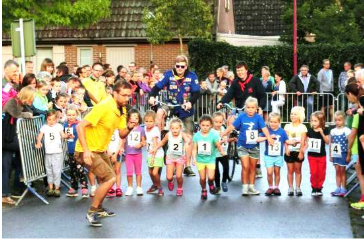
Start in Wildert in 2015.

Omdat de Ronde wel van dag tot dag maar niet van jaar tot jaar verhuist zijn heel wat parkoersen zo in het geheugen van iedereen gegrift dat de medewerkers ze bijna op automatische piloot kunnen rechtzetten. Met talloze nadarhekken, en met piketten en daartussen roodwit lint of oranje touw, wordt voor elk parkoers een basis gelegd. Dat vergt alleen in Horendonk nog echt denkwerk, want na een zig moet een zag volgen. Een startlijn en een aankomstlijn zijn ook noodzakelijk. De hindernissen op dinsdag moeten er al vooraf staan. En het gemeentebestuur heeft speciaal voor de Ronde enkele antieke nadarhekken opzijgezet die op woensdag in Heikant kunnen