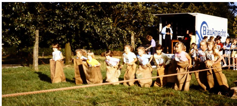
Zaklopen in Hoek in 1989.

Maar dat blijft geen jaren goed gaan. De situatie leidde in 2001 in goede verstandhouding met de Jeugdraad tot de oprichting van een afzonderlijke Stuurgroep. Die Stuurgroep koos na enkele jaren voor de eigen herkenbaarheid om gele t-shirts te gaan dragen. Elke verwarring met de gele truidragers is evenwel uitgesloten : bij de Stuurgroepleden staat het logo op de rug, niet op de buik. De oprichting van de Stuurgroep