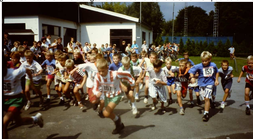
Start van de finale - Jeugdheem 1993.