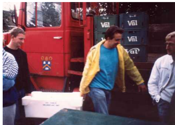
Visi's om de drank te koelen - 1988

Deelnemen aan de Ronde is gratis. Meer nog : het brengt op, want elke deelnemer krijgt een diploma en een prijs. De Ronde organiseren is natuurlijk niet gratis : er zijn balpennen en kaften nodig, er moeten gele truien, medailles en prijzen worden gekocht en boekjes gedrukt, er wordt een springkasteel gehuurd, ... Echte sponsoring heeft de Ronde nooit gewild, al werd af en toe wel eens iets aanvaard in ruil voor enige publiciteit, met name de rugnummers die gedurende vele jaren door Gazet Van Antwerpen en later door andere bedrijven werden geschonken. Het gemeentebestuur draagt een aantal kosten rechtstreeks. En daarnaast zorgen de verkoop van drank en etenswaren voor de nodige inkomsten. Ook de Ronde-Echo's worden verkocht en brengen dus wat geld in het laatje, en de bescheiden merchandising van Rondedekleding en andere -gadgets levert ook wel wat op.