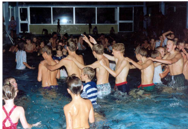
Discozwemmen in 1994.

Met een tweede vernieuwingsgolf in 2001 werd er opnieuw gesleuteld aan het programma. Het discozwemmen werd af en toe vervangen door een kinderfui, al werd meestal toch voor het zwembad gekozen – tot De Vennen definitief tegen de vlakte ging, natuurlijk. Ook de ballonwedstrijd bleef, tot het besef kwam dat helium niet zo goed is voor het leefmilieu. Activiteiten ná het lopen, zoals de dropping of de heksentocht gingen eruit, want ouders zijn graag niet te laat thuis. In de plaats kwamen schminken en XXL-games. Aan de Oude Pastorij werd buikschuiven een klassieker, en later ook bakstapelen. En een springkasteel mag ook niet ontbreken. Zeker op zaterdag is het immers zaak om iedereen voldoende lang bezig te houden : het lopen zelf wordt wat meer uitgesponnen, de pauze duurt wat langer, er is een volkscross en op het einde volgt de prijsuitreiking. Ondertussen moeten de diploma's worden gemaakt (vroeger handgeschreven, de laatste twintig jaar komen ze uit de printer) en een laatste boekje met de einduitslagen.