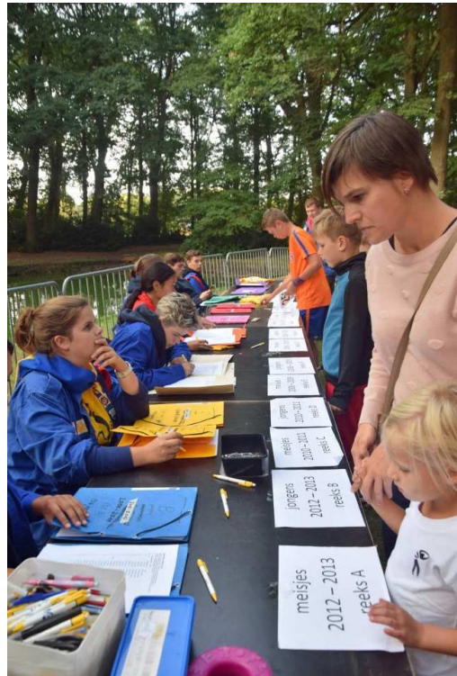
Inschrijvingstafel Hoek 2018.