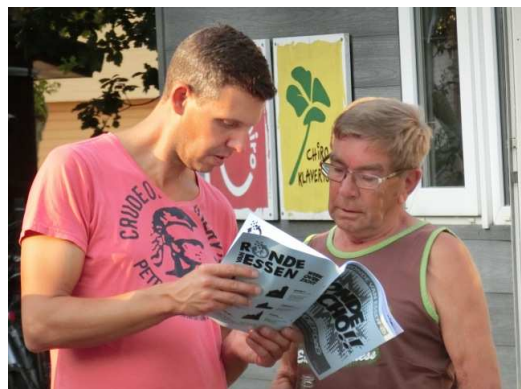
Iedereen leest de Ronde-Echo - Horendonk 2016