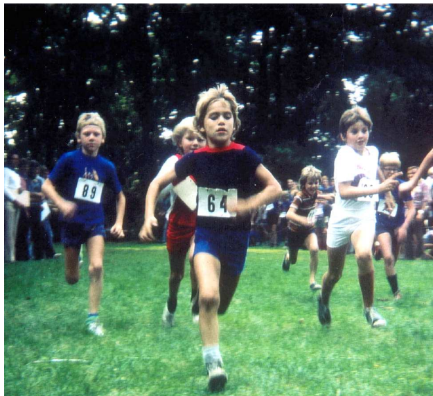
Achter de Oude Pastorijs in 1975.

De Ronde van Frankrijk mag dan wel mee als inspiratie hebben gediend, veel fietsen zijn aan de Ronde nooit te pas gekomen, tenzij als volgfietser om eventueel gevallen lopertjes op te lappen of op te rapen. De Ronde van Essen is een loopronde. In de