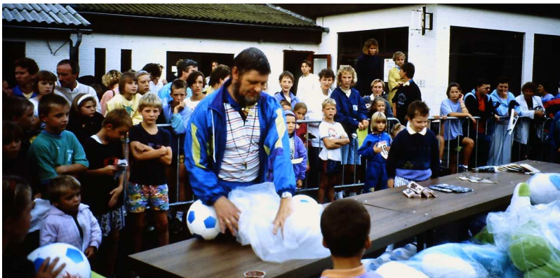
De prijszettafel in 1990 met de toen traditionele ballen van het IJSboerke.